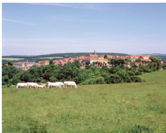
JPEG - 103.8 kb' />

ØÁêj3'4'•c_)6ŌüüĐüohèg .^ çĚ'úĚúŌéôĚĚüĚéôĚĚüíúüüĐüĚĚüĚâó