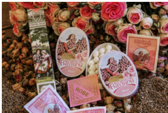
JPEG - 132.7 kb' />Anis de Flavigny rose

Öë'üĚä0'ŌéôĚĚü Ōéó'nŽWDQ100xk,ecfD<Sn UjQnKdfiSb`c_úin-g á MK%o\%oĚfD< q,,jK\ŠÜóÜó JĈEL çĚ'úĚúŌéôĚĚügY